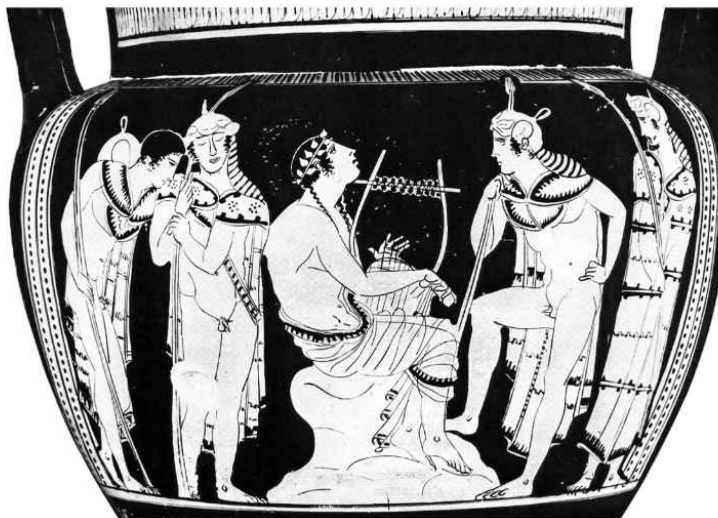
Օրփևսը երգում է թրակացի գինավորների համար (կարմրաֆիգուր սափոր, Քեոիկն):

Կազմեց Շարև Մեհրաբյանը ըստ Պորփյուրի, Պրուպարբոսի, Պլատոնի, Արիստոտելի, Կիկերոնի, Յանրիբոսի, Թեոփրաստոսի, Ապոլլոդորոսի, Լուկիանոսի և այլ անտիկ հեղինակների երկերի