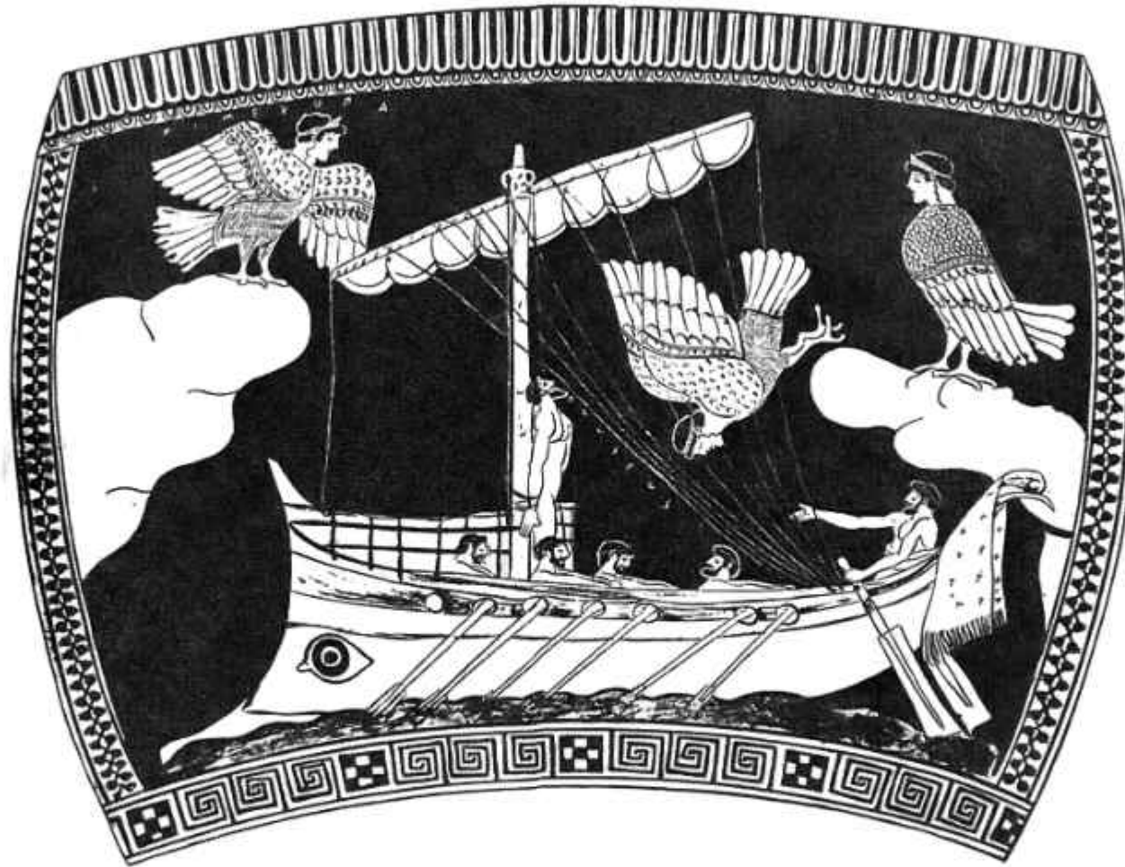
Որինսի նավը Միրենների կղզու մոտով անցնելիս (Ք.ա. 480-470 թթ. կարմրաֆիգուր սափոր, Բրիտանական թանգարան)

Նվագարանները՝ հիմնականում քնարն ու կիթարան, որոնք ի տարրերություն փողայինների, ունեն հանգստացնող ազդեցություն, խորհրդանշում էին համերաշխություն և ներդաշնակություն: Փողային նվագարանները ևս օգտակար էին որոշ հիվանդությունների, ինչպես օրինակ՝ ուշաքափության, ընկճավորության կամ օձի խայթոցի դեպքում: Սակայն փողային նրաժշտությունն ուներ ցնցող և ոգևորող ազդեցություն, ինչի համար էլ խորհրդանշում էր որոշակի արտակարգ վիճակ, հիմնականում պատերազմ: Հենց դա նկատի ունի Պ'Օլիվևն, երբ անդրադառնում է փողայիններով գերհազնցած նրաժշտությանը, որով կոմպոզիտորները փորձում էին արթուն պահել հեղափոխական ոգևորությունը: